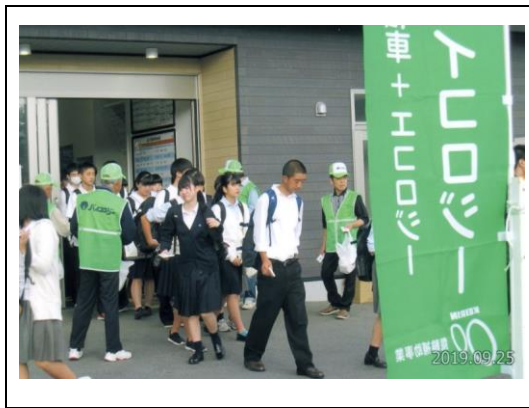
統一事業(山形バイクロジー)