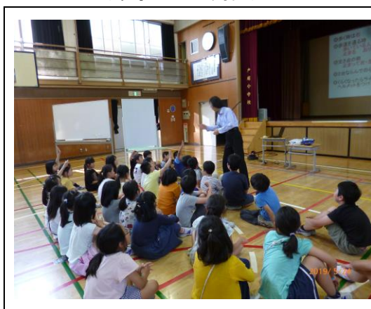
自転車交通安全教室 (品川区立戸越小学校)