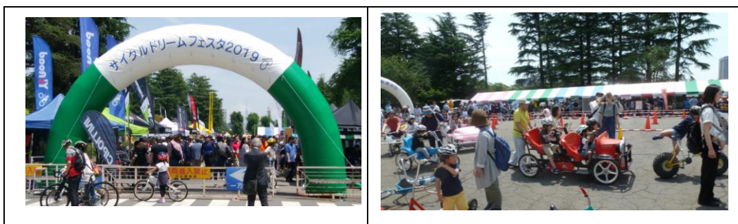
「サイクルドリームフェスタ2019」入り口