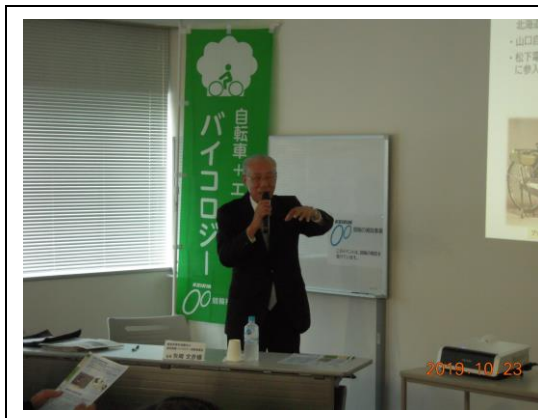
18組織21名、一般・関係団体34名

自転車を安心して乗ることができる環境づくりや今後の自転車のあり方を検討し、自転車市民権運動の活発化を図るため、バイクロジー地方組織の地域ごとに講師を招聘し、バイクロジー運動のリーダー育成を目的としたセミナーを開催した。