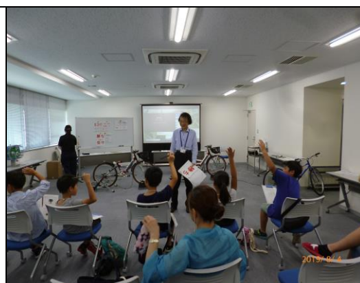
夏休み自転車教室 「自転車の科学教室」