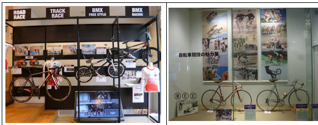
「自転車競技の魅力展」