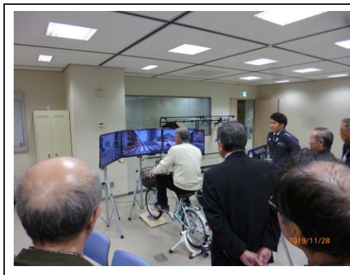
自転車安全利用講習会 (東京しごと財団)