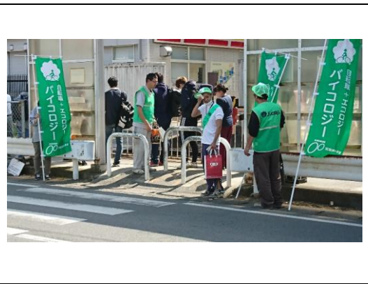
統一事業(熊本バイクロジー)