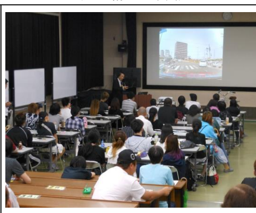
自転車交通安全教室 (大阪府立三国ヶ丘高等学校)

また、自転車の楽しみや魅力を伝えることを目指し、夏休みと春休みの期間中に一般の人が参加・体験でき、特に夏休みの期間については、自由研究の課題にも活用できる教室を開催した。併せて自転車の正しい乗り方についての安全利用講習も行った。